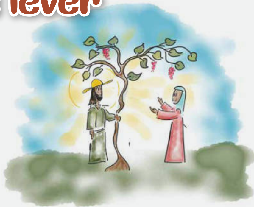
ILLUSTRASJON / ERLING RANTRUD

Etter at Jesus døde, kom vennene hans og tok han ned fra korset og svøpte kroppen hans i rent tøy. De la han i graven, som var en hule i en bakke. En stor, tung stein ble rullet foran graven for å stenge den. Soldater vokter graven så ingen skulle fjerne kroppen til Jesus.