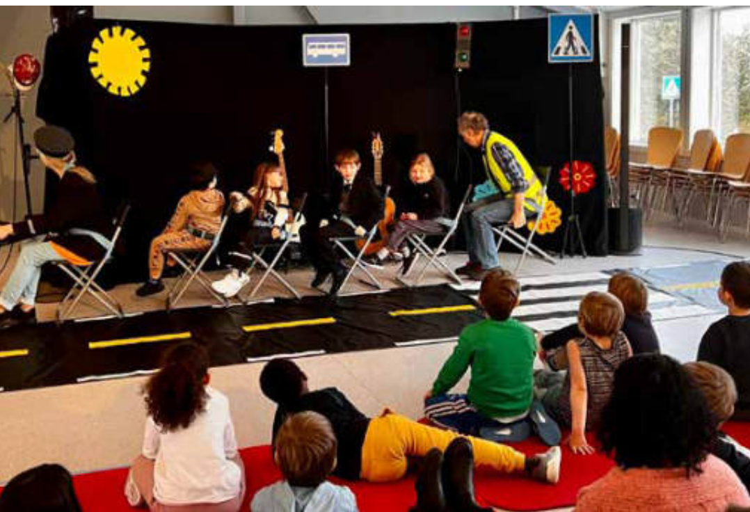
Kikka er bussjåfør, og Laffen er umulig passasjer. Elevene var flinke og lærevillige passasjerer.

På Moe skole er tradisjonen å ha misjonsuke i uke 7. Da lærer alle klassene mye om landet og prosjektet det samles inn til. Og høydepunktet er altså misjonsbasaren som avslutter uka. Her er det solgt lodd og samlet inn masse premier. I tillegg har både små og store kunnet gjette på hvor