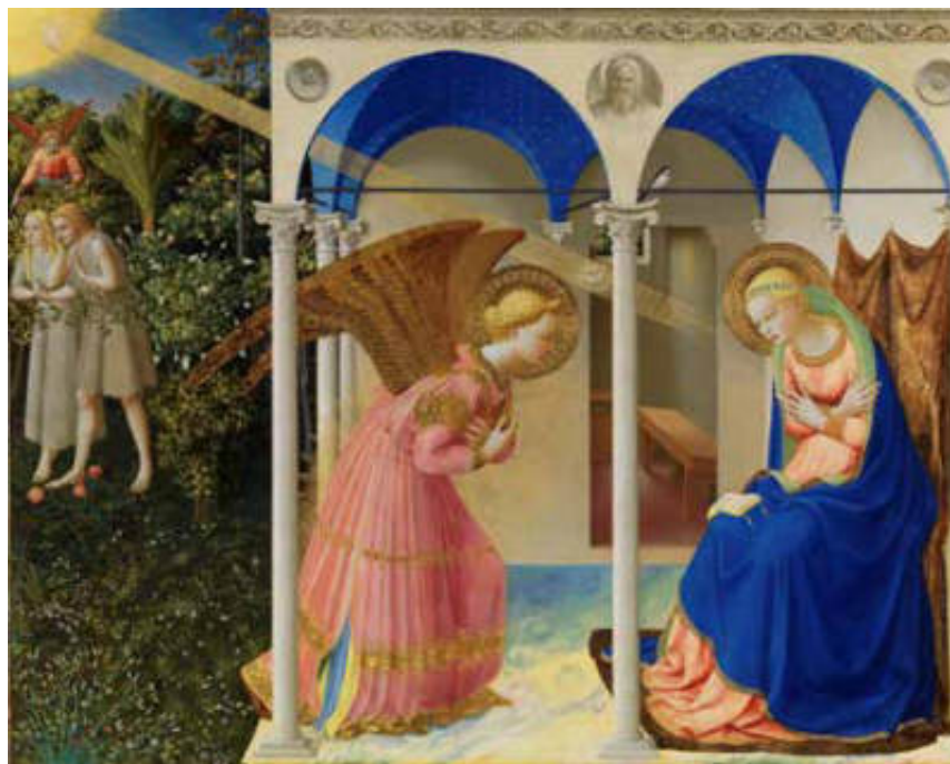
Fra Angelico, Bebudelsen (Prado-museet).

Mange synes det er vanskelig å tro på jomfrufødselen, men i virkeligheten er det ikke noe annet enn en konkretisering av troen på Gud som skaper. Og da Maria svarte: «Se, jeg er Herrens tjenestekvinne. La det skje med meg som du har sagt» (Luk 1,38), var skaperunderet allerede en realitet.